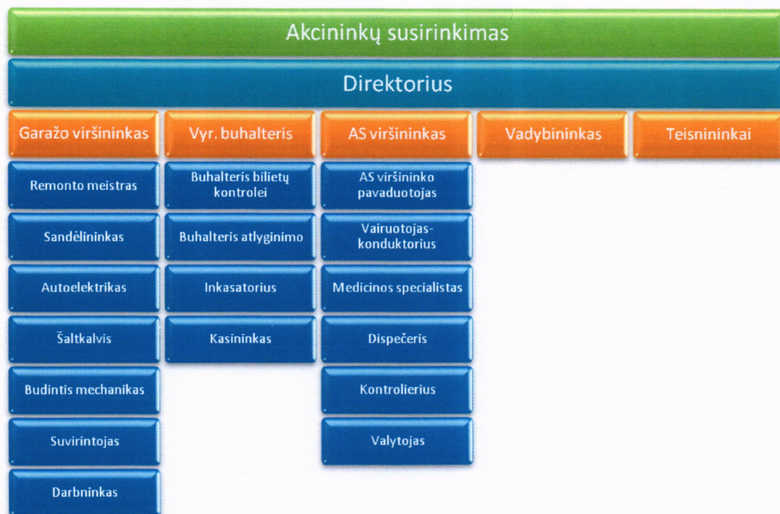
2 schema. UAB "Šalčininkų autobusų parkas" valdymo schema