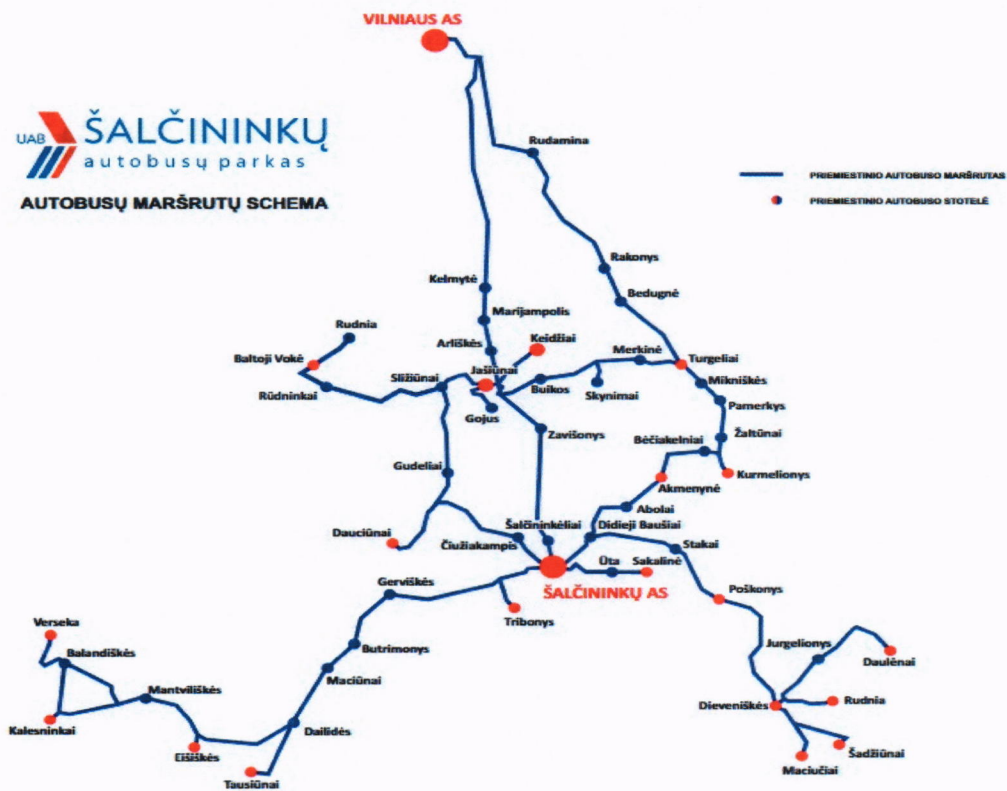
1 schema. UAB "Šalčininkų autobusų parkas" maršrutu schema