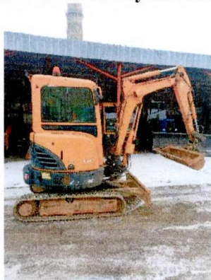
Mini ekskavatorius Hyundai 25z-9