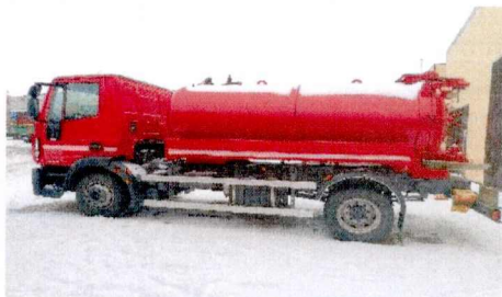
Asenizacinė (vakuuminė) mašina Iveco