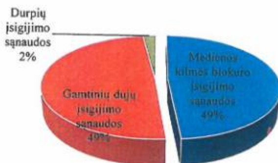
2 pav. Šilumos gamybai naudojamo kuro sąnaudos, Eur.

3. Durpių įsigijimo sąnaudos – 33 119 Eur (2021 m. – 7 114 Eur), tai sudarė 2,07 proc. visų kuro sąnaudų.